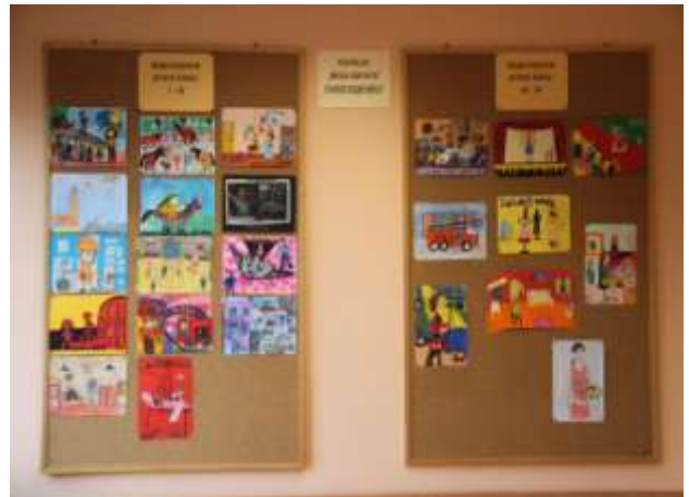
Praca laureatów konkursu plastycznego „Moja Kariera”